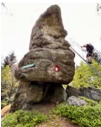
20 Stufen führen auf den 350 t schweren Schafstein