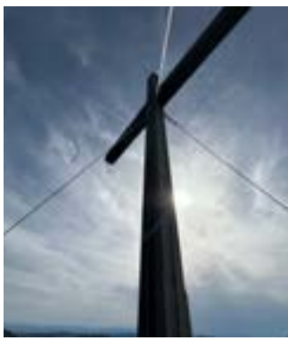
Das Heimkehrerkreuz ragt am Aussichtsturm empor.