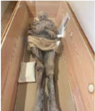
Die Stiftskirche beherbergt 3 Klosterherren als Mumien