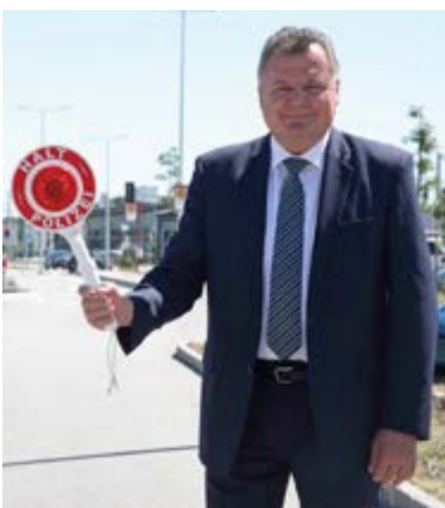
Infrastrukturlandesrat Mag. Günther Steinkehlner zeigt den Schnellfahrern das Stopplicht. „Die Sicherheit auf unseren Straßen ist kein Zufallsprodukt. Die gesetzten Maßnahmen auf der B 309 zeigen nachhaltig Wirkung.“