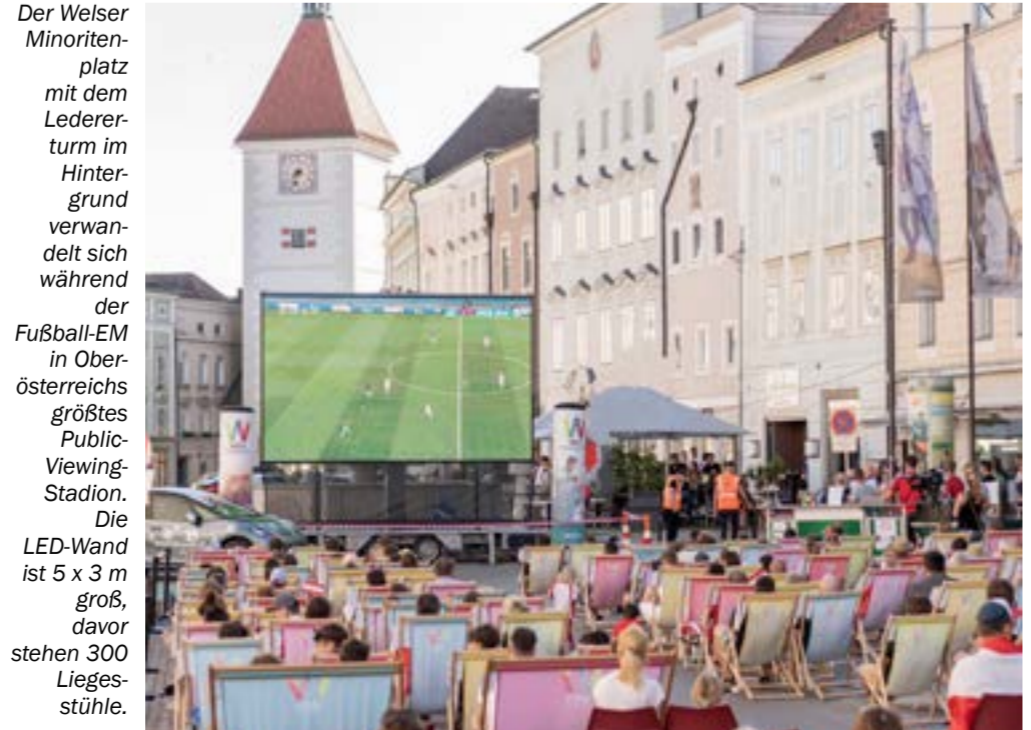
Der Welscher Minoritenplatz mit dem Ledererturm im Hintergrund verwandelt sich während der Fußball-EM in Österreichs größtes Public-Viewing-Stadion. Die LED-Wand ist 5 x 3 m groß, davor stehen 300 Liegestühle.

Wels wird während der Fußball-Europameisterschaft die Fußball-Hauptstadt Österreichs. Von 14. Juni bis 14. Juli das größte Public Viewing im Lande. Es werden nicht nur alle Spiele live am Minoritenplatz zu sehen sein – zusätzlich wird zu den Österreich-Spielen der gesamte Stadtplatz sich in eine Fanmeile verwandeln, eine zweite LED-Wand aufgebaut und ein buntes Rahmenprogramm geboten. Außerdem übertragen über 20 Gastronomiebetriebe mit mehr als 3.000 Sitzplätzen die EM-Spiele in ihren Wirtsstuben und Gastgärten. Dazu veranstalten sie verschiedenste Aktionen. Das gemeinsame Fußballschauen in Wels in Zahlen: 31 Tage - 51 Spiele - 300 Liegestühle - 20 Wirte - 3.000 Sitzplätze. Das „Minoritenstadion“ wird mit einer 5 x 3 Meter großen LED-Wand ausgestattet. An den Österreich-Spieltagen wird eine zusätzliche LED-Wand am Stadtplatz errichtet und das Public Viewing Gelände ausgebaut. Torwandschießen, Fußball und zahlreiche Gewinnspiele sind zusätzliche Attraktionen. So spendet beispielsweise Budweiser für jedes erzielte Tor des österreichischen Teams ein 50-Liter-Fass Bier. Die Zuseher dürfen sich dann auf ein frisch gezapftes Freibier freuen.