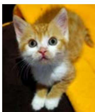
Junge Samtpfote als Neugierdsnase.