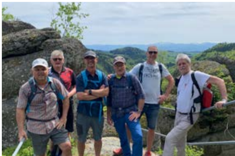
Die erklimmbare Falkenmauer in 700 m Höhe erreicht man nach etwa 1,5 Stunden wandern. Sie ist durch Leitern und Geländer gut gesichert. In der Mitte des Horizonts sieht man den Ötscher mit einer Frühlingssschneehaube.

Oben: Von der gut im Wald versteckten Aussichtsplattform gegen Ende der Rundtour sieht man hinunter auf Waldhausen mit dem Stift und dem Badesee. Bei klarer Sicht reicht der Blick bis ins Gesäuse, zum Toten Gebirge und weit hinein ins Mühlviertel. Nach 30 Minuten Gehzeit laden in Waldhausen gemütliche Wirtshäuser zur Einkehr.